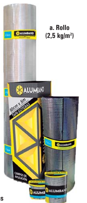
a. Rollo (2,5 kg/m 2 )